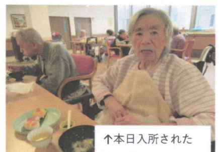
↑本日入所された 方です。