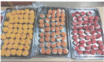
←ラップで包み、可愛く丸く作り ました。彩りよ くできました。 錦糸卵・サーモ ン・まぐろです。