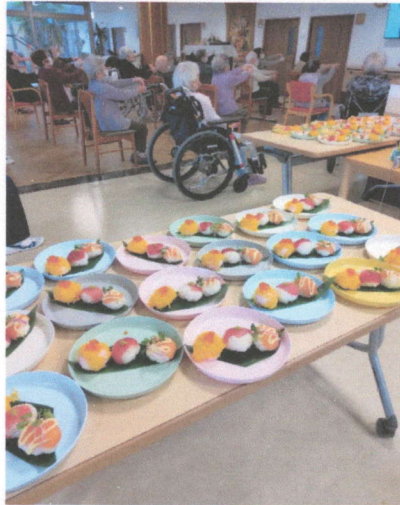
↓ 職員の皆さんが、手際よく手伝ってくれるのでい つも助かります。てまり寿司も丸めてもらいました。 器用なのでいつも頼りにしていました。