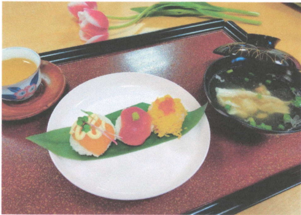
↓本日の食材「鯛のあら」はサービスで戴きました。 身も汁の具に使用しました。