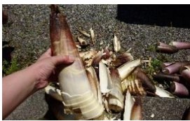
スタッフが茶娘となり皆様のところへ♪ 新茶の香りに包まれて旬のタケノコおにぎりも一緒にいただきました