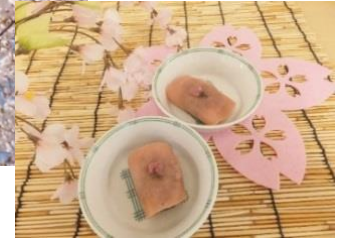
青空の中、桜の下で飲む甘酒 舞い散る花びらを見ながら食べるお菓子は格別でした♪