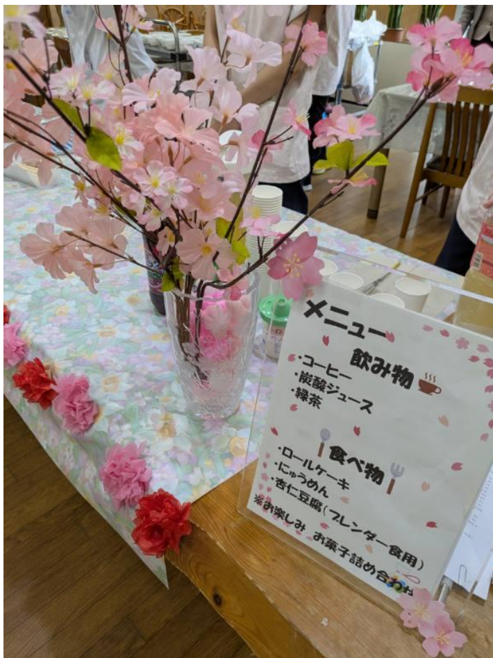
メニューは、ケーキとにゅうめんとお飲み物